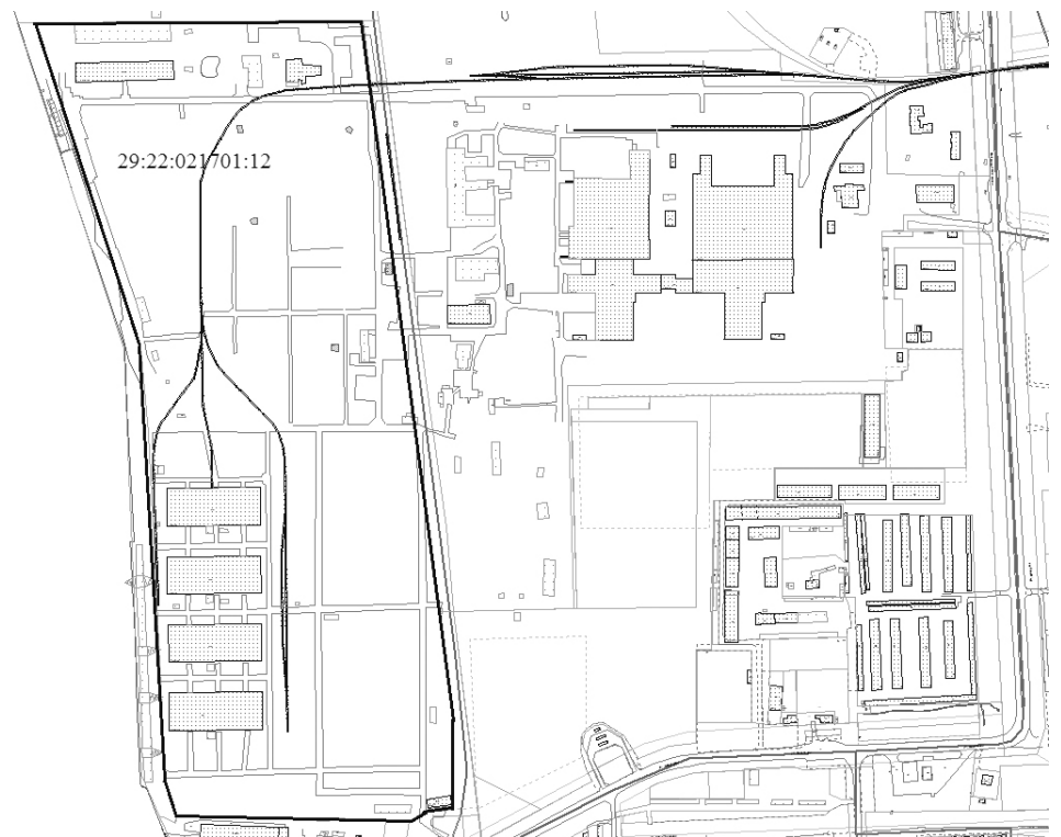
СХЕМА планируемого к размещению линейного объекта

к техническому заданию на подготовку документации по планировке территории для размещения линейного объекта «Сооружения железнодорожного тупика в Соломбальском территориальном округе г.Архангельска по ул.Маймаксанской»