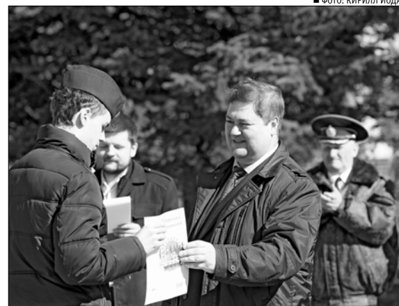
■ ФОТО: КИРИЛЛ ИОДАС